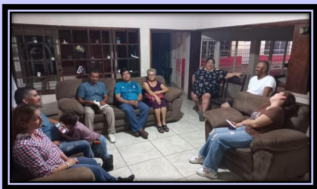
Estudio bíblico en Coahuyana, Michoacán.

Por las familias de los pueblos que visitamos, que sigan creciendo en fe y compromiso con Dios. Por más obreros en la región.