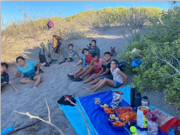
Día de excursión con el grupo PCD