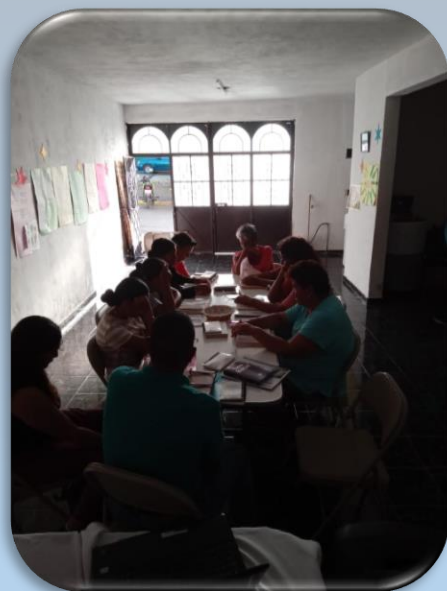
Tomando el Discipulado Pasa y Ayúdanos 3.0

Dios siga bendiciendo su obra en Valle de Santiago, y que la iglesia continúe llevando su palabra. Por el club de niños, los nuevos contactos, las colonias donde se están llevando discipulados, Bugambillas, Socorro, Manuel Serrano y Francisco Villa.