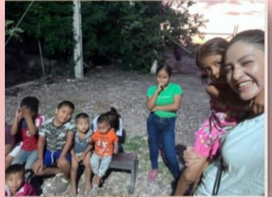
Campos agrícolas Culiacán