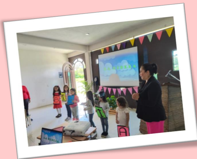
Actividad con niños

Que pronto nos organicemos como iglesia.