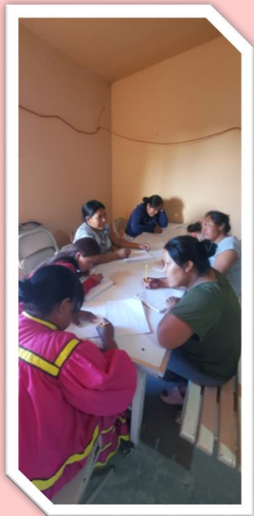
Tiempo de alfabetización.