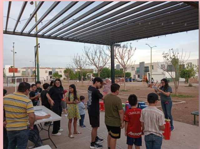
Club de Iglesia local